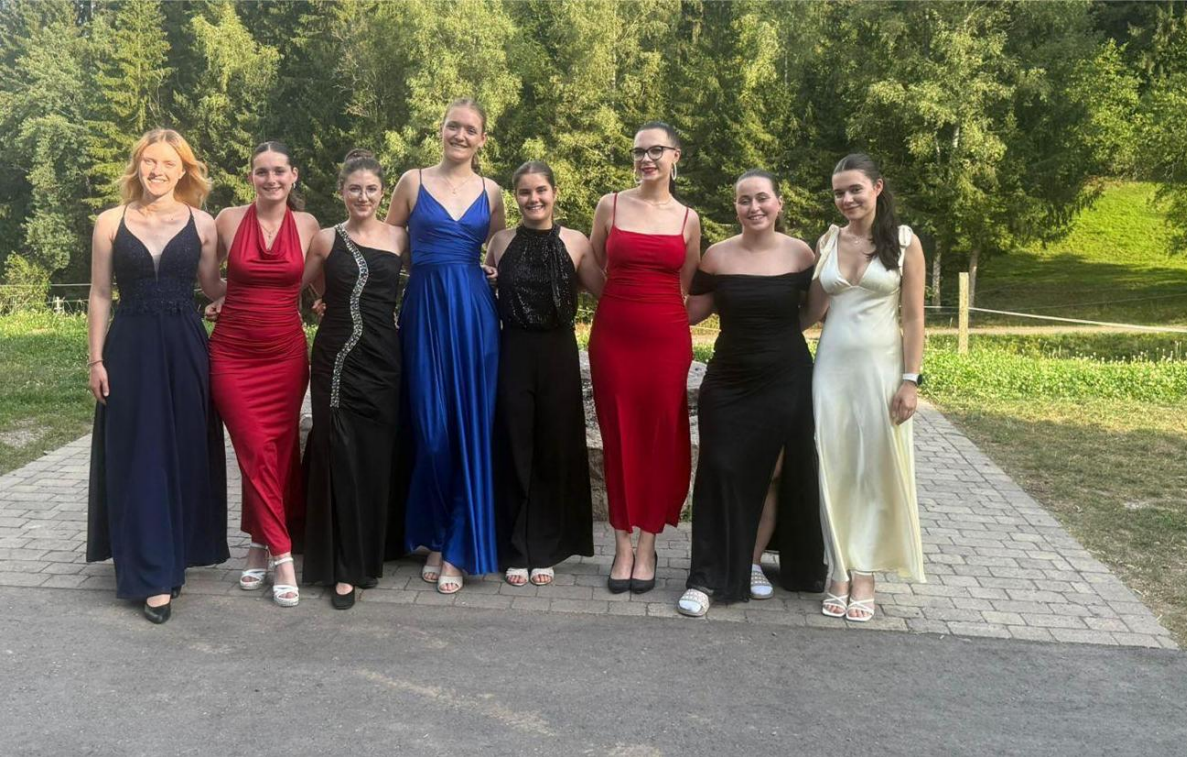
Leiterinnen der Mädchenfreizeit