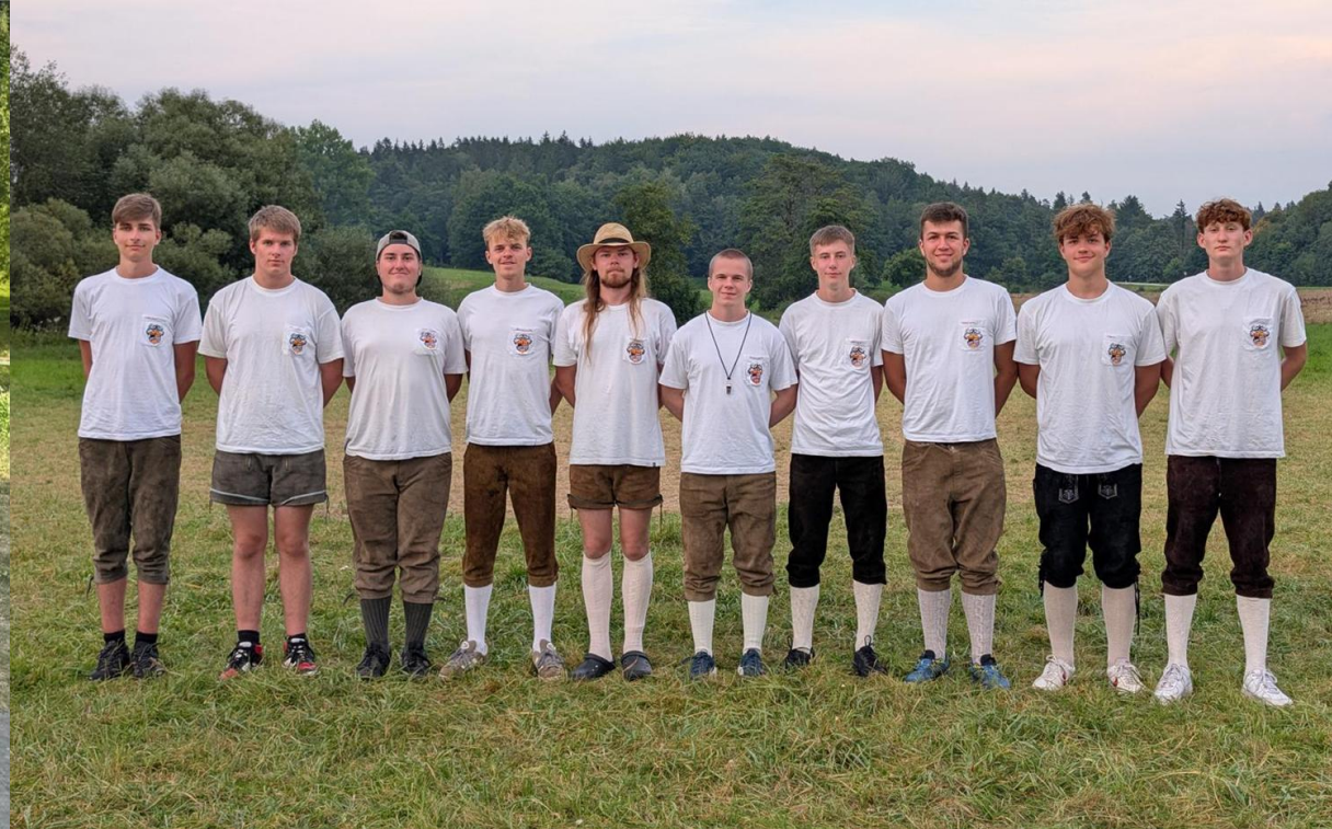
Leiter des Zeltlagers