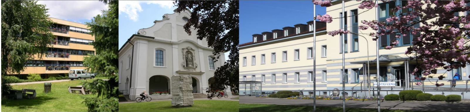
St. Josephshaus, Herten

Bestandsanalyse, Entwicklung von Optimierungsvarianten, strategisches Immobilienkonzept als Masterplan