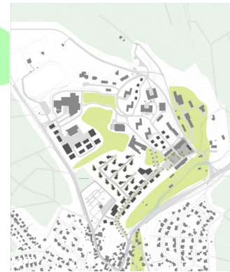
Johannes-Diakonie Mosbach e.V.

Masterplan für die Standorte Mosbach und Schwarzach