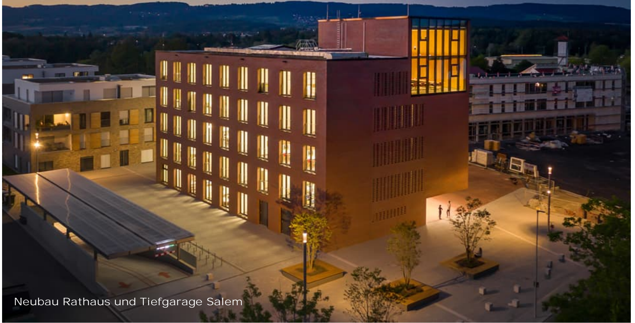
Neubau Rathaus und Tiefgarage Salem