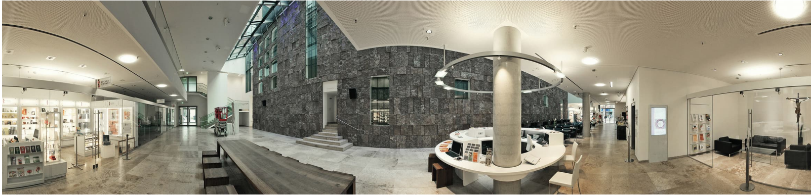
Kath. Stadtdekanat Stuttgart

Analyse Liegenschaften, Untersuchung Entwicklungsvarianten, städtebauliche Konzepte, Wirtschaftlichkeitsanalyse