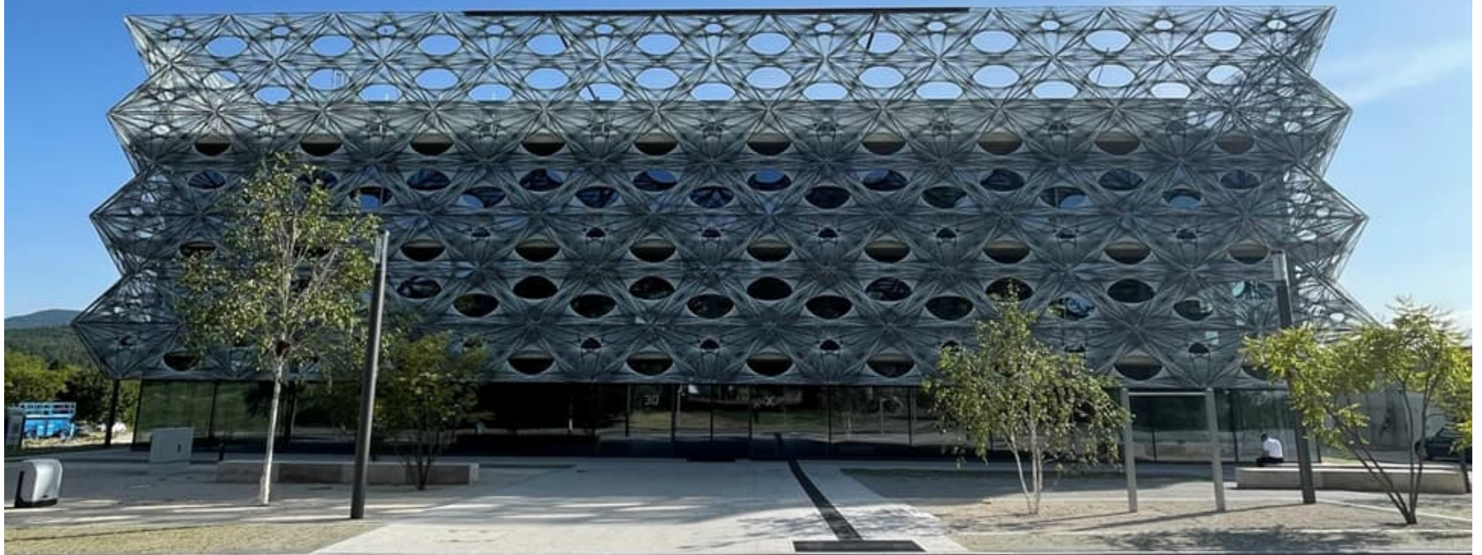
Neubau Texoversum , Reutlingen