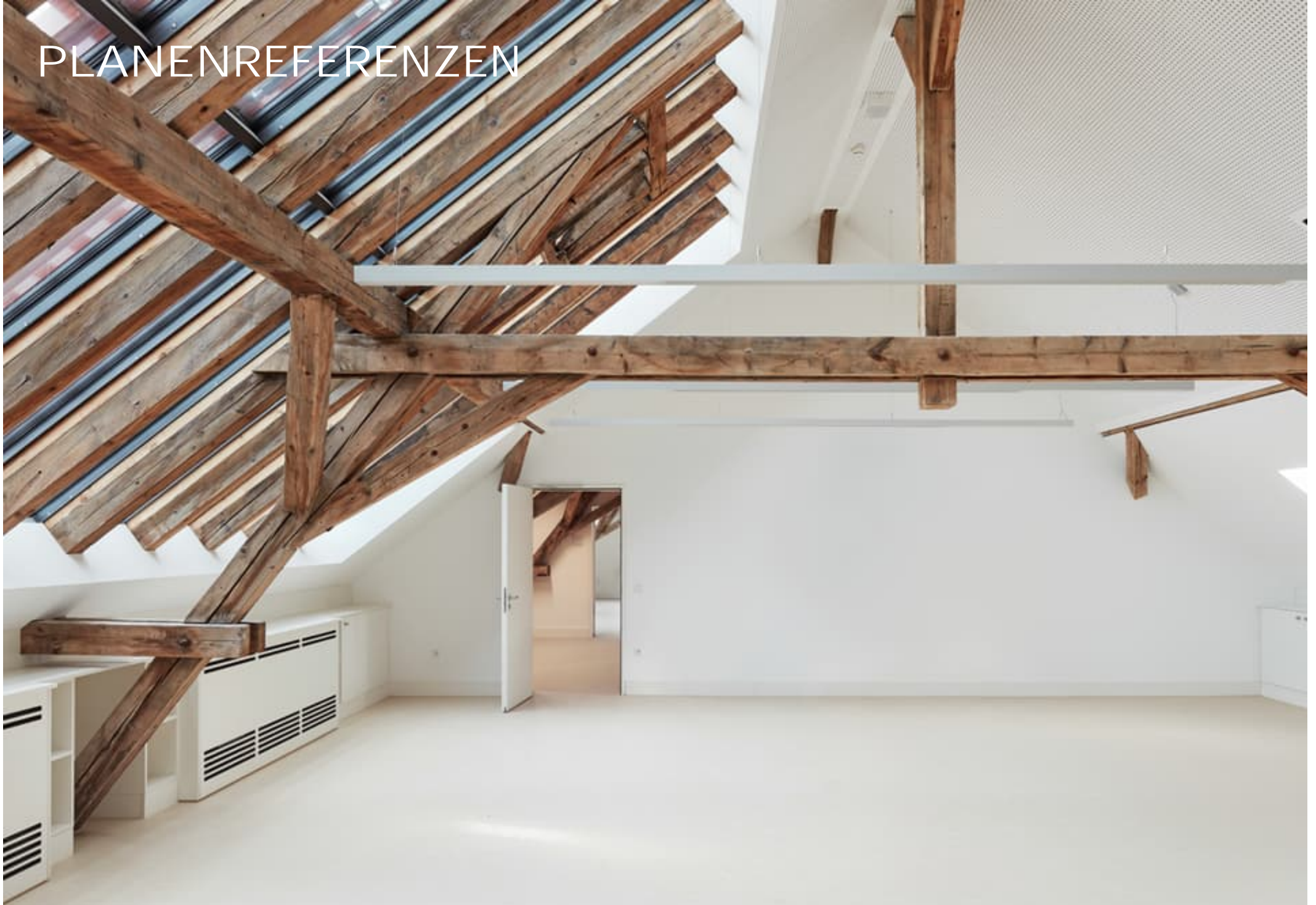
Umbau und Modernisierung der denkmalgeschützten Katharinschule Esslingen