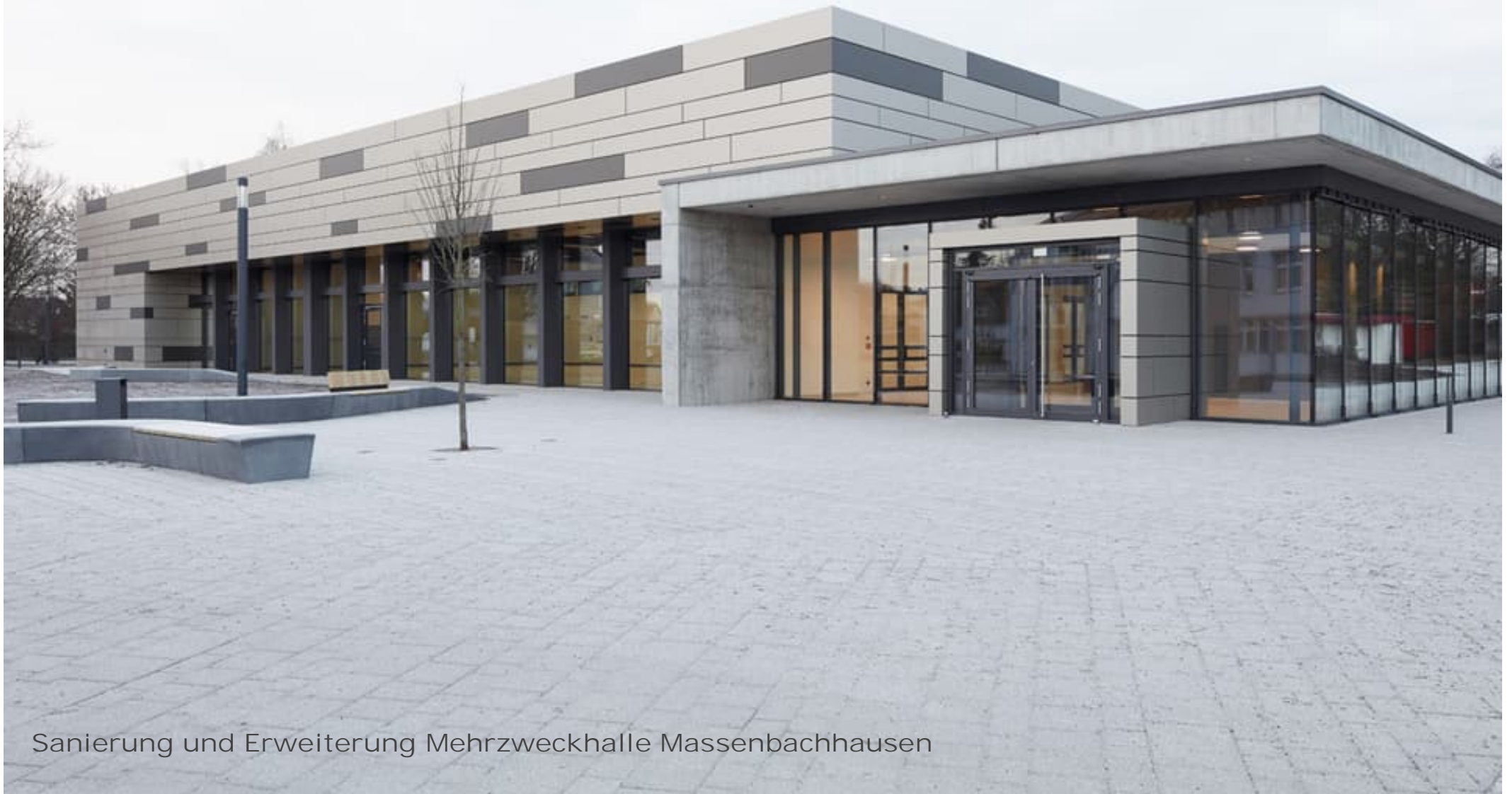
Sanierung und Erweiterung Mehrzweckhalle Massenbachhausen